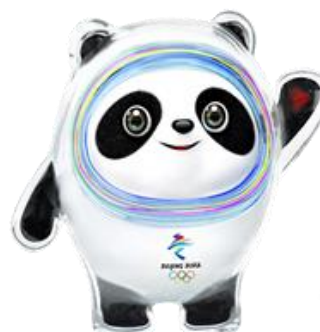
BING DWEN DWEN, MASCOTTE VAN 2022