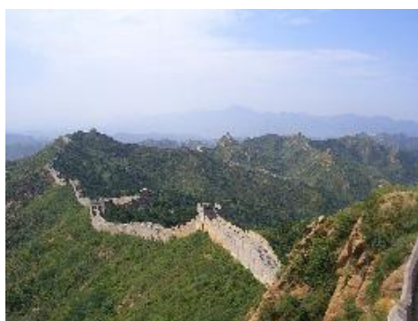
DE CHINESE MUUR