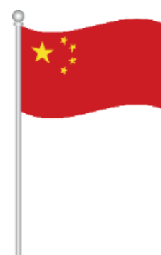
DE CHINESE VLAG