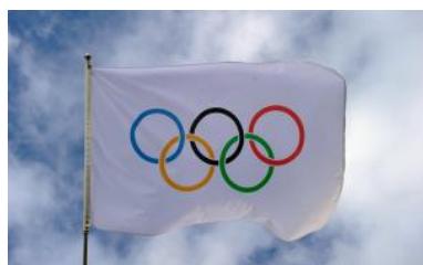
DE OLYMPISCHE VLAG