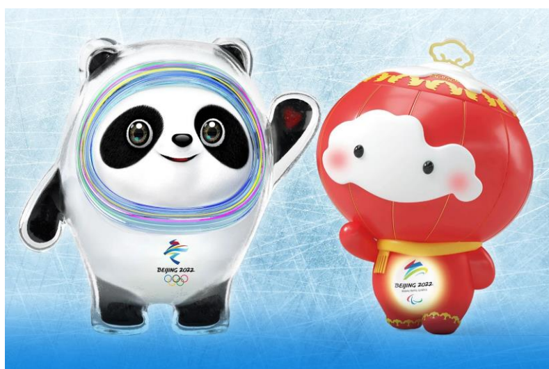
DE MASCOTTES VAN BEIJING 2022

Sinds 1968 is er tijdens de Spelen een speciale mascotte. Een mascotte staat symbool voor het land waar de Spelen gehouden worden. Elke Olympische Spelen heeft dus een eigen nieuwe mascotte. Mascottes kunnen de sporters oppeppen, of geluk brengen. Soms zijn er meerdere mascottes tegelijk, zoals in Beijing. Vaak zeggen de mascottes iets over het land waar de Olympische Spelen gehouden worden.