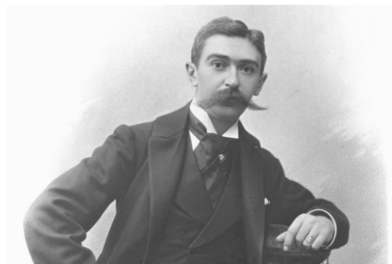
PIERRE DE COUBERTIN