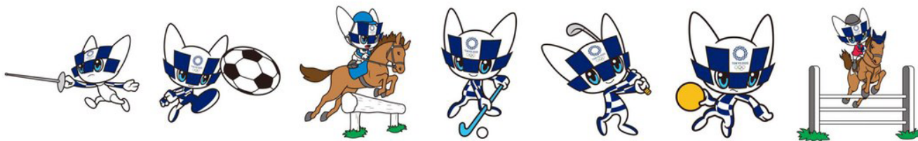
De mascotte van Tokyo 2020