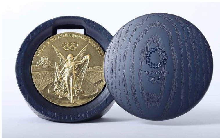
De medaille van Tokyo 2020