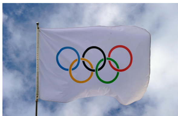
De olympische vlag