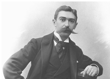
Pierre de Coubertin

Lang geleden, in de tijd van de Grieken en Romeinen werden de Olympische Spelen al gehouden. In Olympia, in Griekenland. Maar ongeveer 1600 jaar geleden stopten ze ermee. 200 jaar geleden werden de resten van het oude Olympia opgegraven. De Fransman Pierre de Coubertin vond dat zo interessant dat hij zin kreeg om de Olympische Spelen weer te houden. Hij vond sport ook erg belangrijk. Dus zorgde hij er in 1896 voor dat de Olympische Spelen na lange tijd weer werden gehouden. In Athene, de hoofdstad van Griekenland. De Spelen duurden toen 10 dagen.