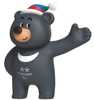
Bandabi mascotte voor de Paralympische Spelen