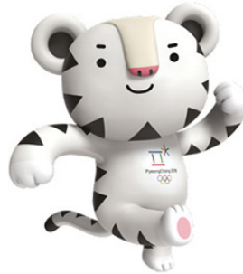
Sohorang mascotte voor de Olympische Spelen

Sohorang (de witte tijger, die symbool staat voor vertrouwen, kracht en bescherming) en Bandabi (de Aziatische zwarte beer, die symbool staat voor doorzettingsvermogen en moed).